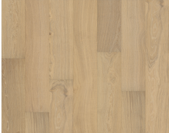
EICHE PARIS GEÖLT