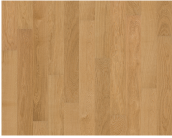
EICHE DUBLIN ULTRA MATT NARROW