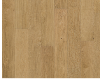
EICHE DUBLIN GEÖLT