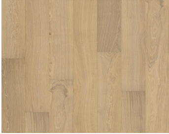
EICHE PARIS GEÖLT