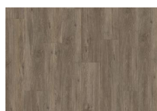
SAREK DRY BACK