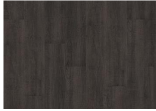
VALDIVIAN DRY BACK