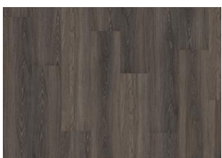
TONGASS DRY BACK