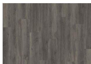
NIAGARA DRY BACK