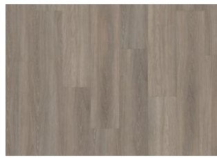
WHINFELL DRY BACK