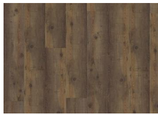
KOMI DRY BACK