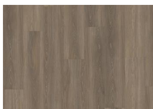
TIVEDEN DRY BACK