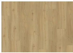
OULANKA DRY BACK