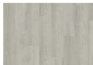
YUKON DRY BACK