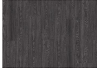
HUMBOLDT DRY BACK