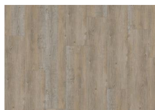
CORMORANT DRY BACK