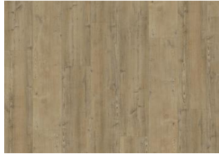
WAIPOUA DRY BACK