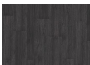
SCHWARZWALD DRY BACK