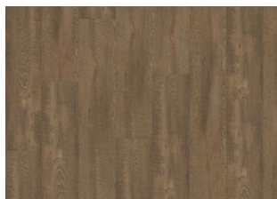
DURMITOR DRY BACK