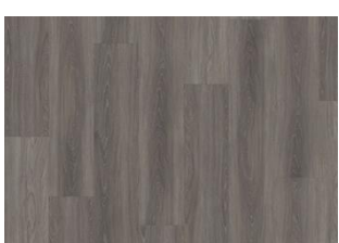
WENTWOOD DRY BACK