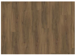
REDWOOD DRY BACK