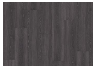
CALDER DRY BACK