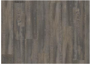
DAINTREE DRY BACK