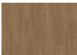
SHERWOOD DRY BACK