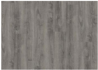
PLITVICE DRY BACK