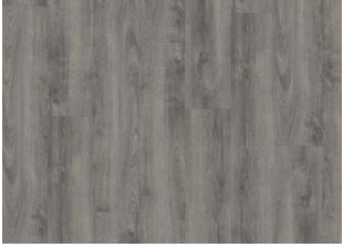
PLITVICE DRY BACK