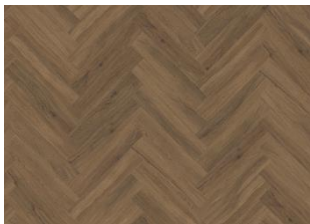
REDWOOD DRY BACK FISCHGRAT