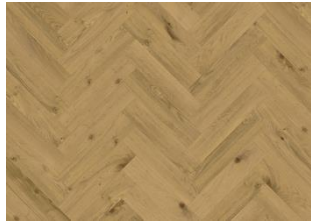
MOESGAARD DRY BACK FISCHGRAT