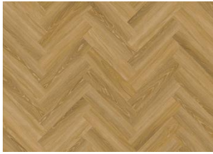
FONTIN DRY BACK FISCHGRAT