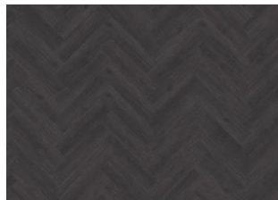
SCHWARZWALD DRY BACK FISCHGRAT