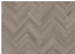
WHINFELL DRY BACK FISCHGRAT