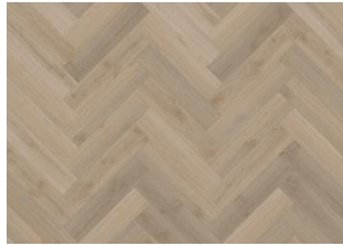
KILSBERGEN DRY BACK FISCHGRAT