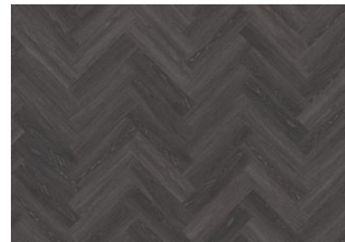
CALDER DRY BACK FISCHGRAT