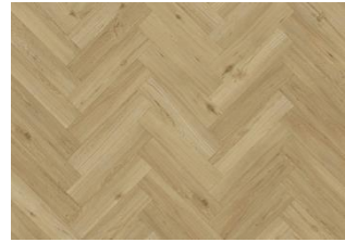
OULANKA DRY BACK FISCHGRAT