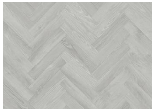
YUKON DRY BACK FISCHGRAT