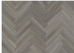
WENTWOOD DRY BACK FISCHGRAT