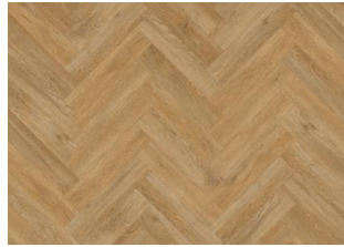
SAPO DRY BACK FISCHGRAT