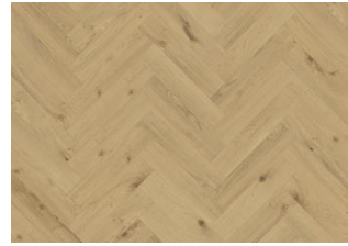
COCONINO DRY BACK FISCHGRAT