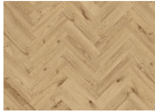
THURINGIAN DRY BACK FISCHGRAT