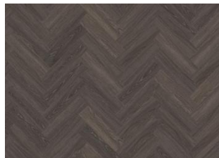
TONGASS DRY BACK FISCHGRAT