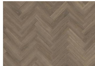
TIVEDEN DRY BACK FISCHGRAT