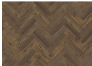
KOMI DRY BACK FISCHGRAT