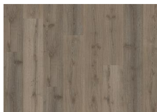
SPREEWALD CLICK XXL