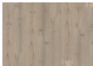
DOVECOT CLICK XXL