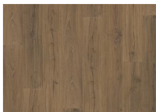
SAHAM CLICK XXL