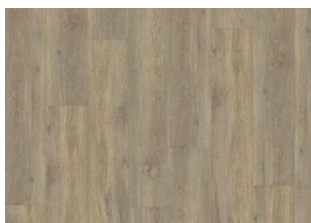
TAIGA CLICK 6 MM