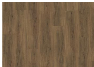
REDWOOD CLICK 6 MM