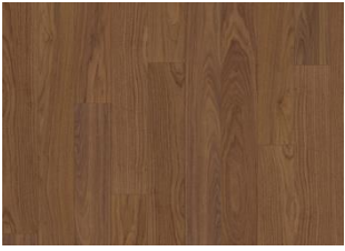
WALNUSS AMERIK CORIANDER