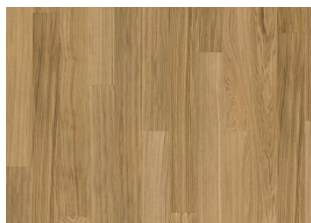
PURE OAK LANDHAUSDIELE