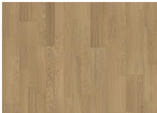
LIGHT SUEDE 2-STAB