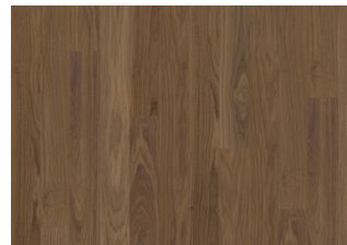
PURE WALNUT LANDHAUSDIELE