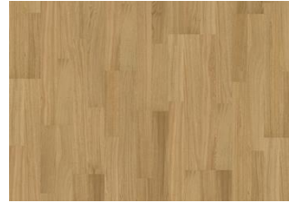
PURE OAK 2-STAB