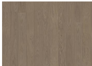
EARL GREY LANDHAUSDIELE