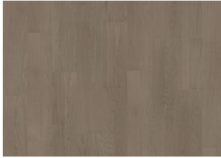
EARL GREY 2-STAB