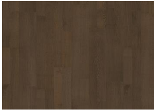
COCOA BEAN 2-STAB