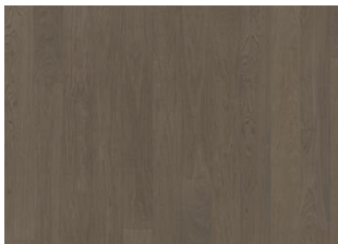
FADED BLACK LANDHAUSDIELE