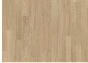
WHOLE GRAIN 2-STAB