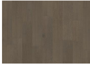
FADED BLACK 2-STAB