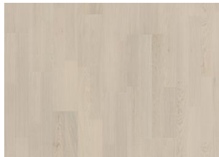
COCONUT CREAM 2-STAB