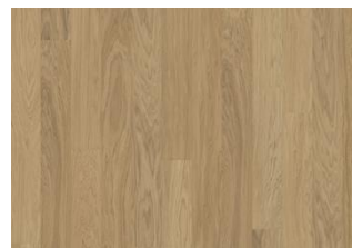
LIGHT SUEDE LANDHAUSDIELE