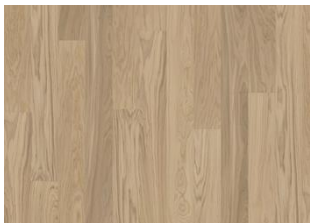
WHOLE GRAIN LANDHAUSDIELE