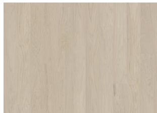
COCONUT CREAM LANDHAUSDIELE