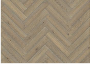
EICHE FISCHGRAT CC VINTAGE WEIß