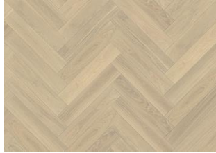
EICHE FISCHGRAT AB CREMEWEIß