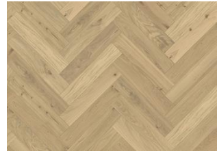
EICHE FISCHGRAT CC DIM