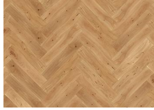
EICHE FISCHGRAT CD GEÖLT