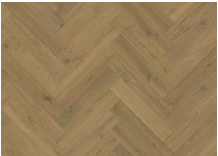
EICHE FISCHGRAT CD GRAU