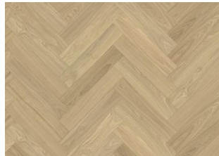
EICHE FISCHGRAT AB DIM