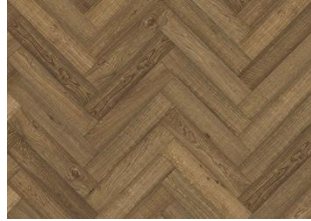
EICHE FISCHGRAT CD VINTAGE GERÄUCHERT