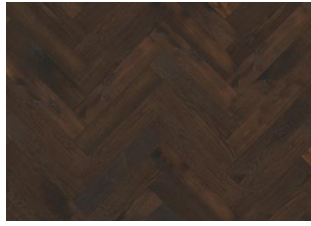
EICHE FISCHGRAT CD GERÄUCHERT