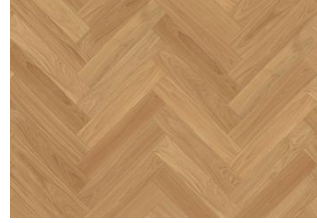
EICHE FISCHGRAT AB