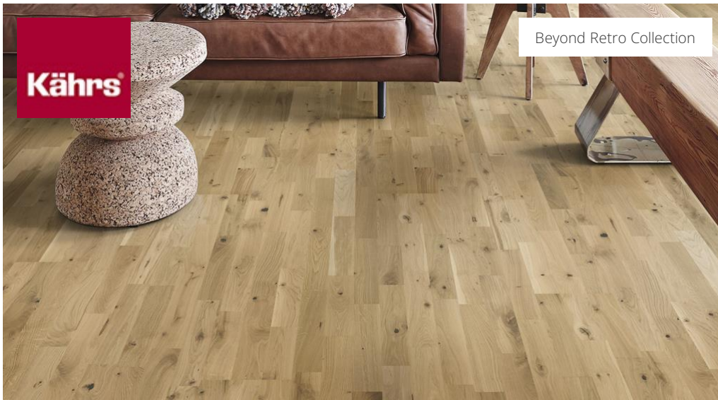
Beyond Retro Collection