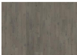
EICHE PEARL GREY