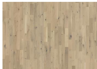
EICHE FROSTED OAT