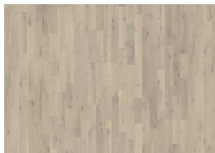
EICHE LOFT WHITE