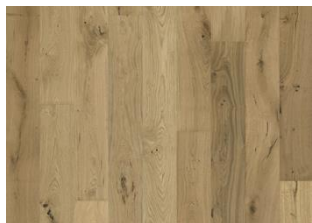
EICHE GRANO GEÖLT